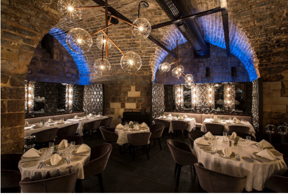
Kaynak : Hışvahan Restoranı İç Mekan Renk Kullanım Görünüşleri (Url-2)

Osmanlı döneminde kullanılan renkler genellikle doğadan ilham alınan ve dönemin kültürel ve sosyal yapısını yansıtan tonlardır. Mimaride ve iç mekân tasarımında kullanılan renkler, dönemin zengin kültürel çeşitliliğini ve estetik anlayışını ortaya koyar. Özellikle mavi, yeşil ve kırmızı gibi renkler, hem dini hem de sosyo-kültürel anlamlar taşır. Hışvahan gibi tarihi yapılar, geçmişin izlerini taşıyan ve kültürel bir miras olarak değerlendirilen yapılar arasında yer almaktadır. Bu nedenle, iç mekan tasarımında renk seçimi yapılırken, yapının tarihi ve kültürel bağlamı göz önünde bulundurulmalıdır. Hışvahan'ın iç mekanlarında da bu durum geçerlidir. Özellikle toprak tonları, bej, kahverengi gibi doğal ve sıcak renkler, Hışvahan'ın tarihi dokusunu yansıtmak için sıklıkla kullanılmıştır. Ayrıca, renk seçiminde, yapının inşa edildiği dönemin estetik anlayışı da dikkate alınmıştır.