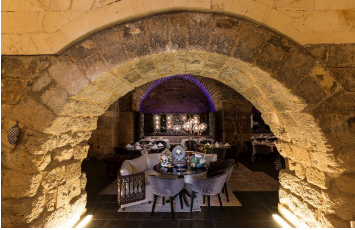
Kaynak: Hışvahan Restoranı İç Mekan Görünüşleri (Url-2)

Hışvahan'ın iç mekanlarında duygusal etkiler ve atmosfer, yapı içinde kullanılan renklerin ve ışıklandırmanın yanı sıra, mimari detaylar ve yapıya özgü öğelerle de şekillenmektedir.