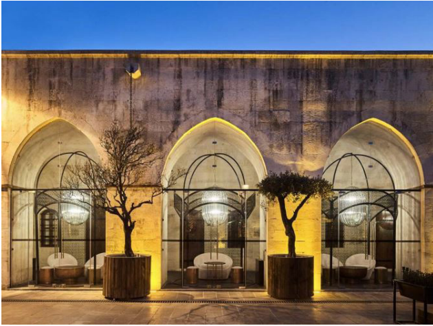
Kaynak: Dođu Cephesi Revak Grnř (Url-2)

Dođal ışıkın deđiřen yođunluđu, gnn farklı saatlerinde yapı iinde farklı atmosferlerin oluřmasına katkıda bulunmaktadır. (zdemir, 2017; Aksoy, 2015) Ayrıca, yapay aydınlatma da Hıřvahan'ın atmosferini řekillendirmektedir. Yapının mimari detaylarına ve i mekan dzenlemesine uygun olarak yerleřtirilen aydınlatma armatrleri, belirli blgeleri vurgulayarak dikkat eker ve ziyaretilere rehberlik etmektedir. (Tanrıku, 2016; Yıldırım, 2018) Bu armatrlerin seimi ve dzenlemesi, yapıdaki tarihi dokuya saygı gsterirken aynı zamanda modern konforu da sađlamaktadır. Hıřvahan'ın tasarımında dođal ıřıktan yođun yararlanılarak renk paletinin sıcaklıđı arttırılmaktadır. Byk pencereler ve aık avlular, gneř ıřıkının i mekanlara dolmasına izin vererek duvarların ve mobilyaların dokularını ve renklerini vurgulamaktadır. Iřık ve rengin bu etkileřimi, gn boyunca dinamik ve davetkar bir atmosfer yaratmaktadır.