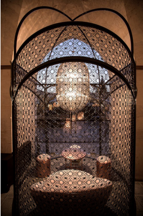
Kaynak: Lobi alanı malzeme, renk ve desen görünüşü (Url-3)

Renk seçimi aynı zamanda yapıdaki mimari detayların vurgulanmasına da yardımcı olmaktadır. Hışvahan gibi tarihi yapıların iç mekanlarında kullanılan renkler, kubbeler, kemerler ve sütunlar gibi mimari öğeleri ön plana çıkararak ziyaretçilere yapıyı daha derinlemesine keşfetme fırsatı sunmaktadır. Bu detaylar, yapıyı sadece bir mimari eserden öte bir hikaye anlatıcısı haline getirmektedir. Aydınlatma, hanın taş duvarlar, kemerler ve ahşap kirişler gibi mimari özelliklerini vurgulamak için stratejik olarak kullanılır. Bu sadece görsel çekiciliği arttırmakla kalmadan, aynı zamanda bu unsurların işçiliğine ve tarihsel önemine de dikkat çekmektedir.